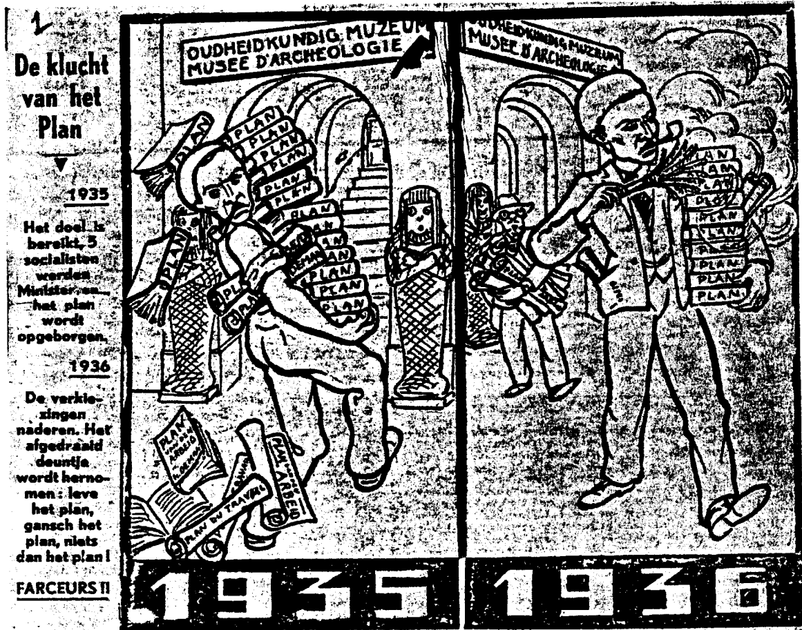
Spotprent "De Klucht van het Plan". (De Tijd, 1 mei 1936)

Auch die Vorschläge De Mans konnten dieses Dilemma nur ansatzweise lösen. Denn um Weimar als Demokratie zu erhalten, hätte die Sozialdemokratie vor allem eines starken Partners bedurft : Eines anderen, demokratischen Bürgertums.