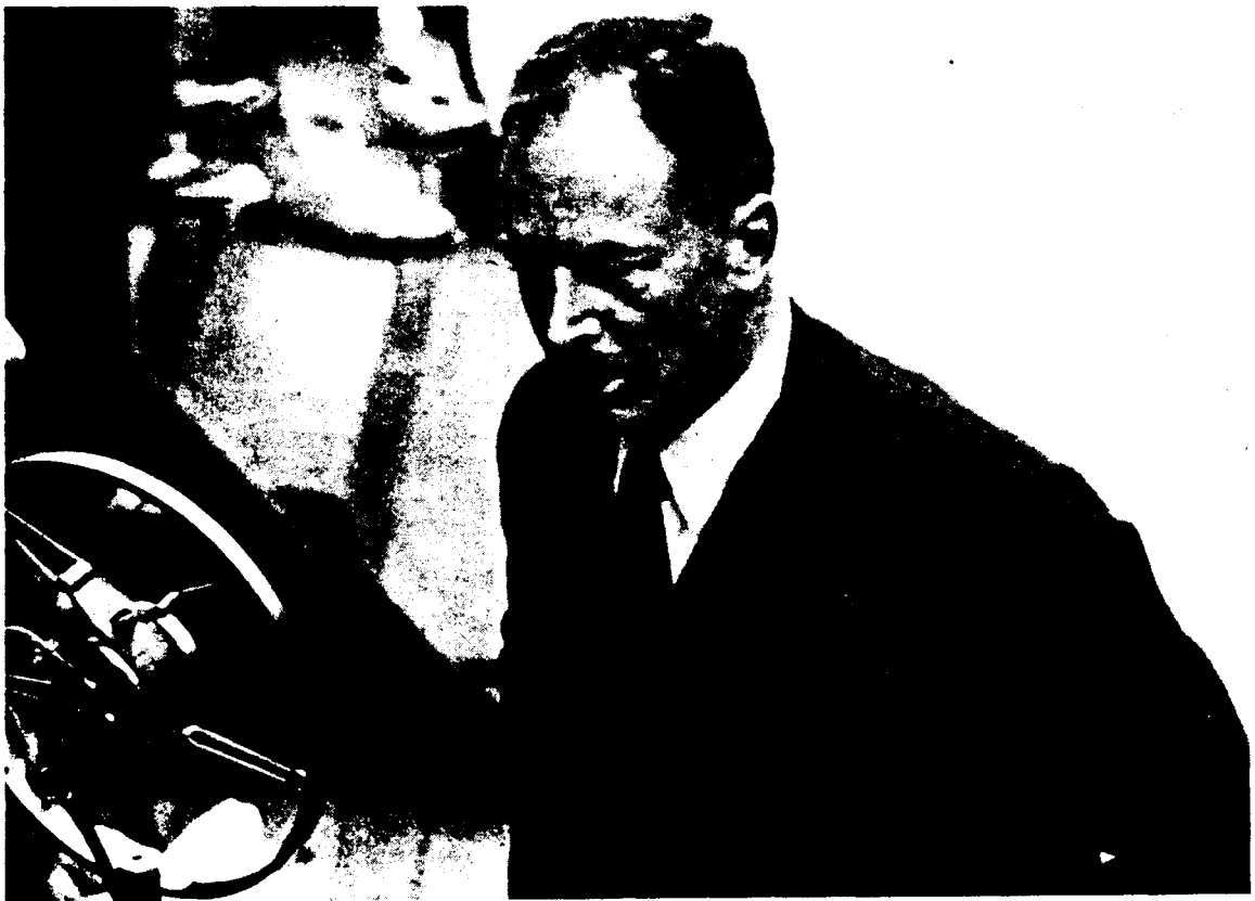
Hendrik de Man tijdens een toespraak. Datum onbekend.