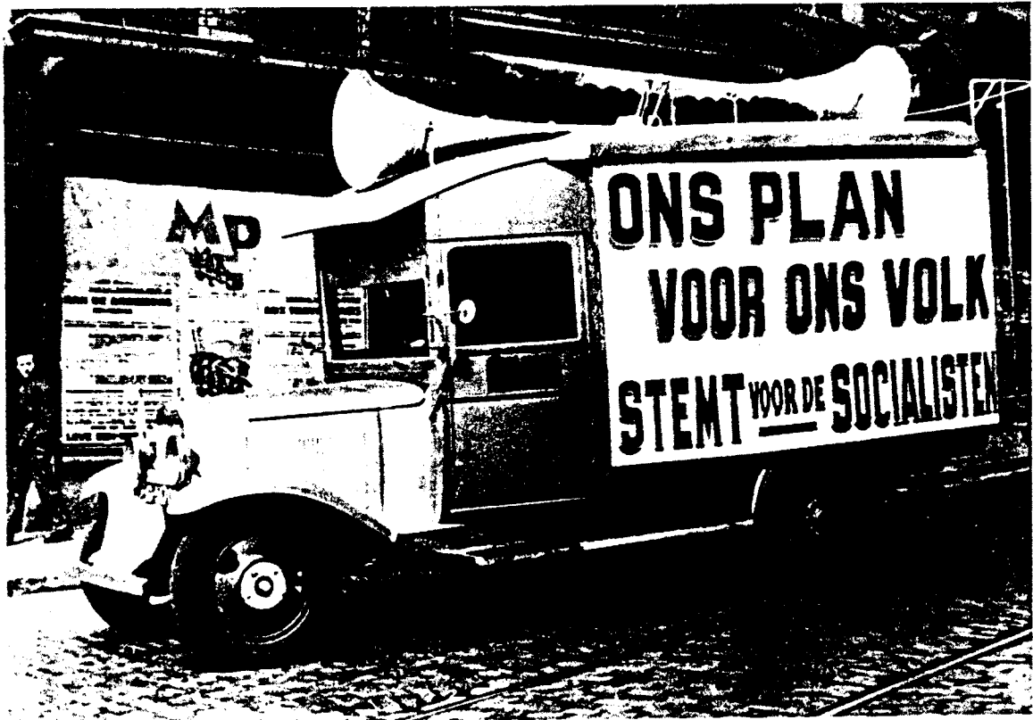
Radiowagen voor de Plan-propaganda